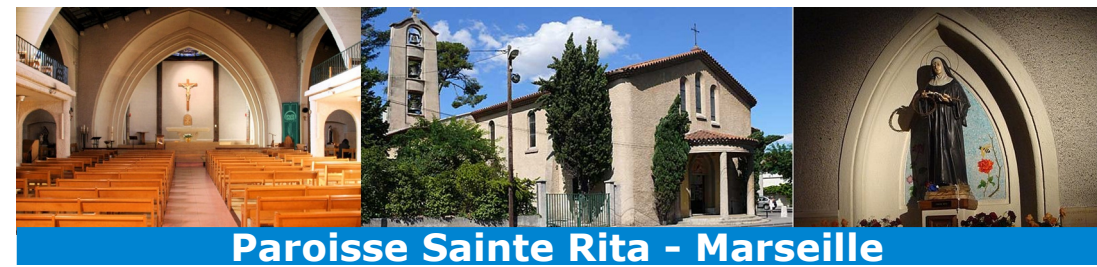
Paroisse Sainte Rita - Marseille